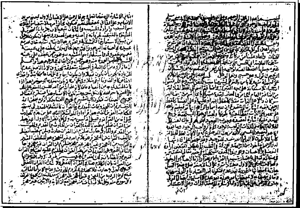
الصفحة الأولى لنسخة (م)